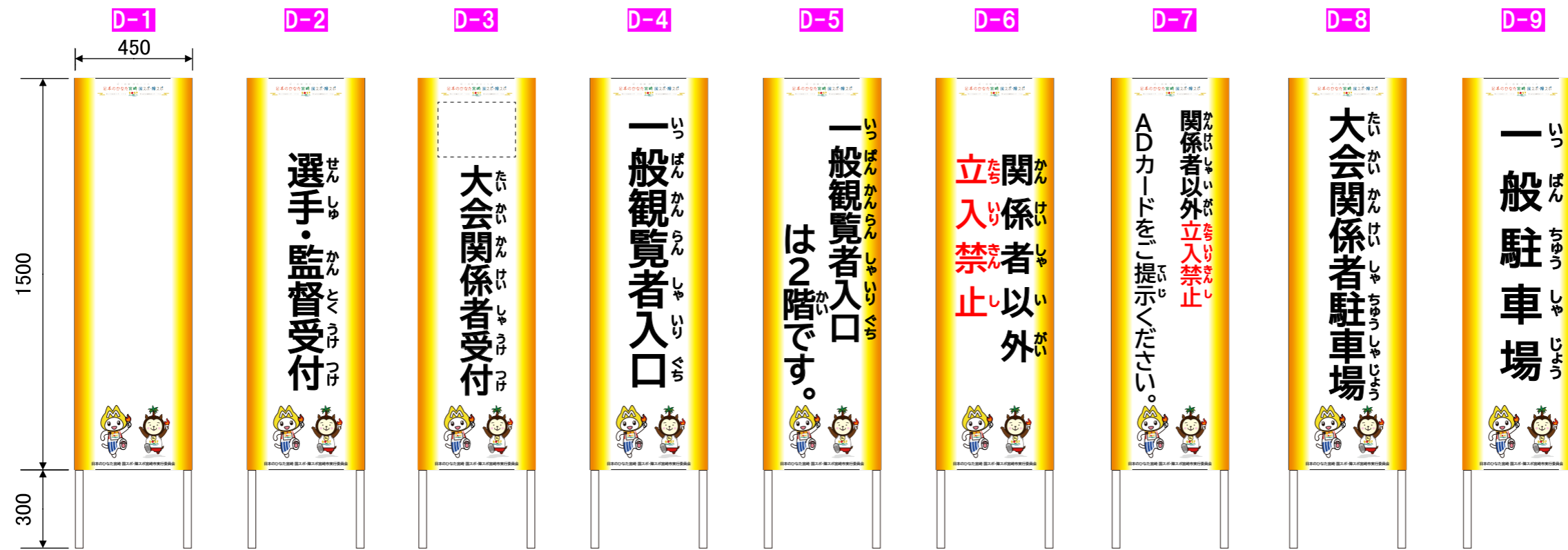
x6式 ※実施本部に納品